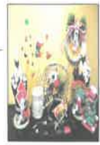
12月24日・25日の両日に、1階地域交流室の喫茶室において、ケーキバイキングのクリスマス会を行いました。口の周りに生クリームを一杯つけた方や、大きなお口をあかれてお口いっぱいにケーキを頬ばるかた、普段と違ったおやつ風景を楽しんでいただきました。25日の昼食には各ユニットにおくましてクリスマス会を行いました。