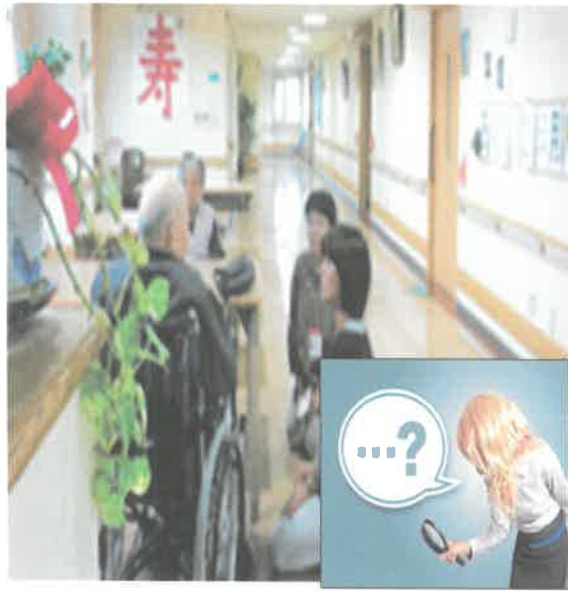
オンブズマン活動風景 (イメージ)

申し出ていただく事など多々あるのではなからなご意見を伺い、活動の改善に努めてまいります。また、施設や職員は活動の場を持ちたいと考えております。