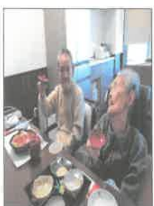
お餅をつき、お正月を祝う。お餅を、お正月を祝う。