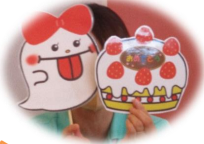
くいしんぼうのおぼけのこ〜♪