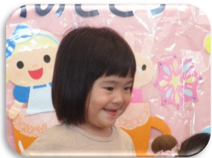
すきなたべものは「うどん!!」