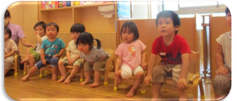
何がでてくるのかな?