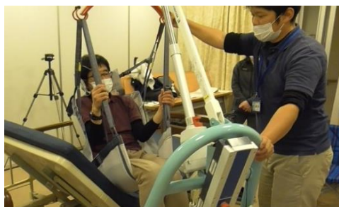
↑導入後の研修風景。実際に体験して知ることも必要。どこに気を使うべきなのか、どうしたら怖くないか、しんどくないか、スタッフ同士で体験して話し合っています。