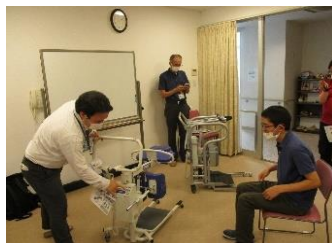
↑デモンストレーションの様子↓

ノーリフティングとは、「押す」「引く」「持ち上げる」「ねじる」「運ぶ」を、過度 な負担を伴う状態で絶対に人力で行わないことです。昨年、ノーリフティング委員 会では、ノーリフティングを行う機器のデモンストレーションを行いました。床走 行式リフト・スタンディングリフト・パワースーツなど、様々な機器を体験し、令 和3年3月に、床走行式リフトを1台導入しました。4月と5月に職員同士で練習 をし、6月から実際に対象のご利用者の介助に使っています。