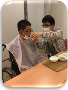
＜新人研修の様子＞ 右上：食事介助 下：排泄介助