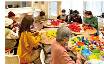
写真：ナーシングホーム智島のゆめ伴サロンで折った折り鶴が、 大阪・関西万博の来場者休憩室に飾られ、多くの観客を出迎えました。

～世界中の皆様と折り鶴でつなごう笑顔の輪！～ ゆめ伴プロジェクト in 門真実行委員会