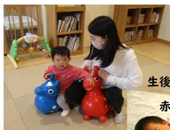
生後1か月の 赤ちゃん