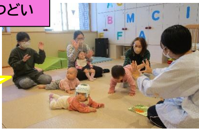
あかちゃんのつどい