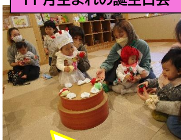
11月生まれの誕生日会