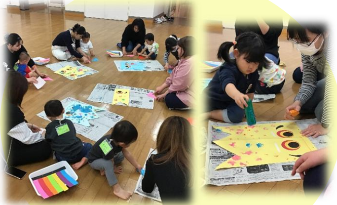
こいのぼり製作をしました！