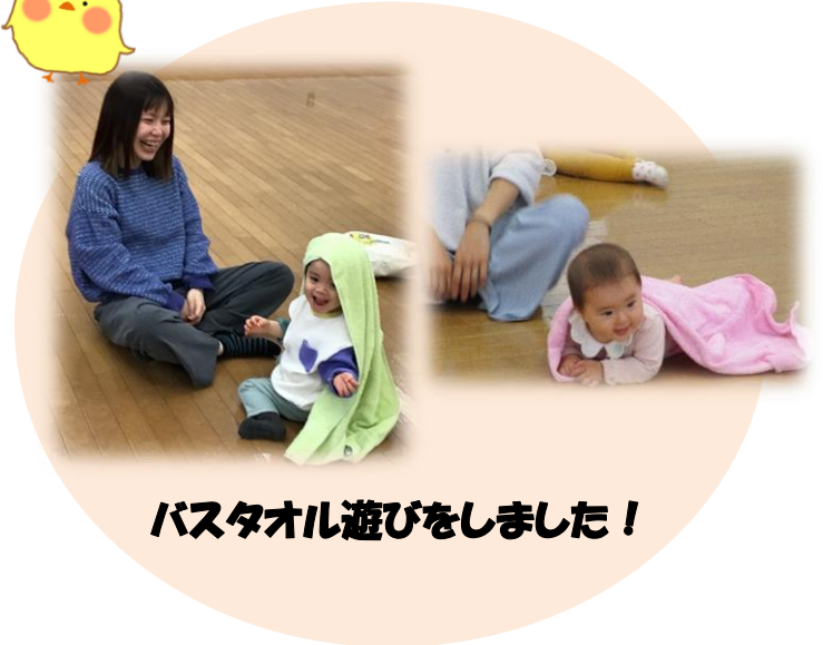
バスタオル遊びをしました！