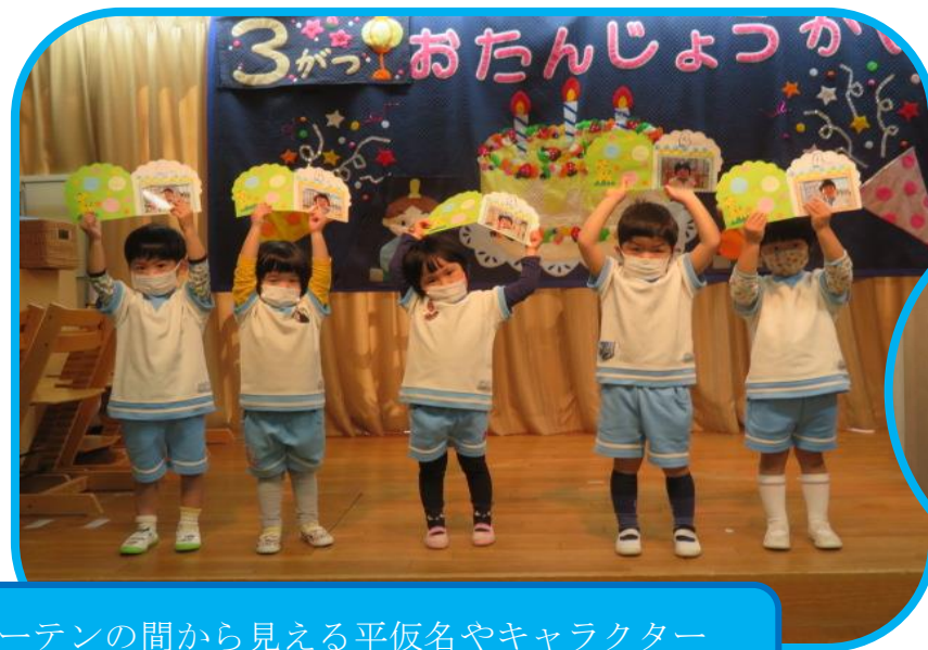
ほし組はカーテンの間から見える平仮名やキャラクターをあてる「通った物はな〜んだ」クイズを行いました。