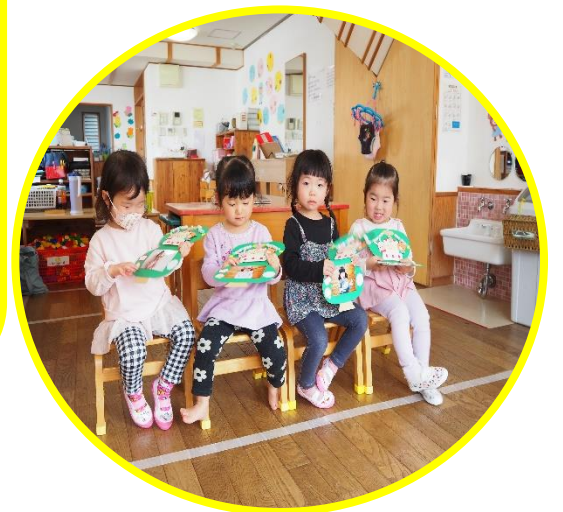
にじ組は「こんこんくしゃん」のスケッチブックシアターを行いました。