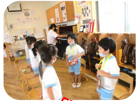
お誕生日おめでとう。