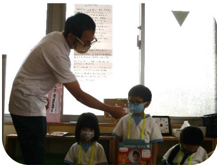
0歳児・1歳児 絵本「いっぽくんのごめんね」