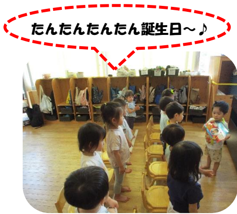
たんたんたんたん誕生日～♪