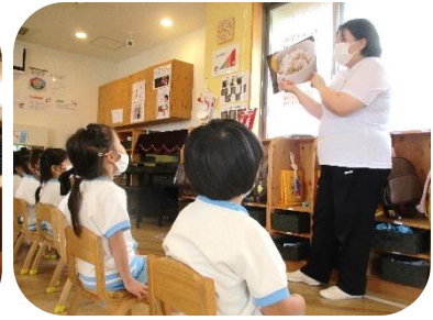
4歳児・5歳児 絵本「へいわってすてきだね」