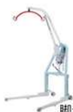
脚部高さ67mm 低床ベッドにも対応可能