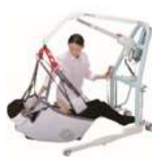
床からの移乗も可能