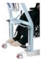
脚部下部が車椅子や 体に干渉しにくい安心設計