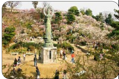
こちらは無料で 梅林に入れますの で、お弁当を持っ てベンチでいただ くことができ、ま たシートを広げて ご友人同士で盛り 上がっている方も おられます。

ご祈祷する法要が 執行されるほか、 信徒会館前では午 前十時から午後四 時までフリーマー ケットも催され、 梅酒「紫雲」、梅 ジュース「みやす 梅」の販売も行わ れます。