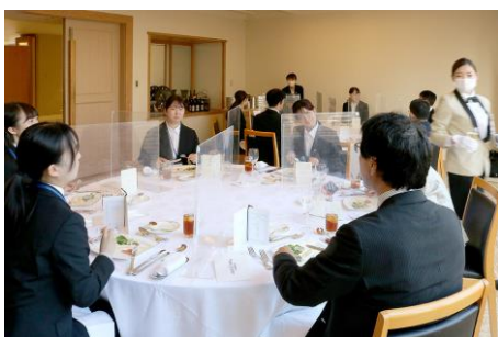
※親睦会場内の様子