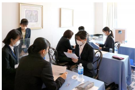
※発表（アイスブレイク）