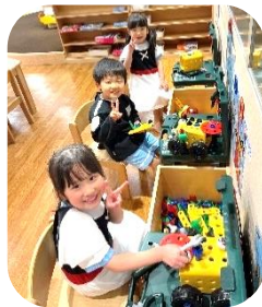
ドライブにいくよ！