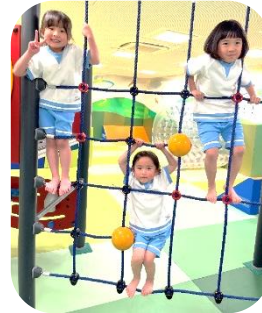
ボールプール気持ちいい