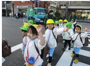
手を挙げて渡ろう

3月7日(土)に2・3歳で、鷺洲中公園に遠足に行きました。異年齢で手を繋ぎ、「白い花が咲いてるね」などと話しながら道に咲く花などに興味を持ちながら歩いていました。公園では保育者と一緒かけっこをしたり、「こっちおいで」と誘いあって遊んでいる姿が微笑ましかったです。十分体を動かしたあとは、楽しみにしていたお弁当を頂きました。レジャーシートを広げ「一緒に座ろ」と声を掛け合い笑顔で美味しくいただきました。帰り道で眠くなる子どももいましたが、最後まで自分の足で歩き帰ってくることができ、少し長い距離でも頑張って歩く姿に成長を感じました。お忙しい中、お弁当のご準備ありがとうございました。