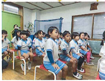
とても真剣な表情で聞いている 子どもたちでした。