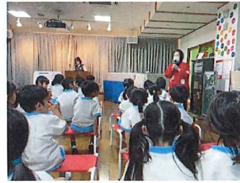
子どもたち、保育教諭共々、貴重な話を 聞かせて頂きました。