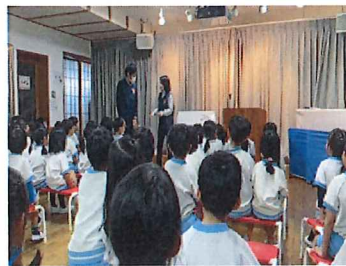
認知症の「寸劇」を見せて頂き、 認知症についてよく知ることが出来ました。