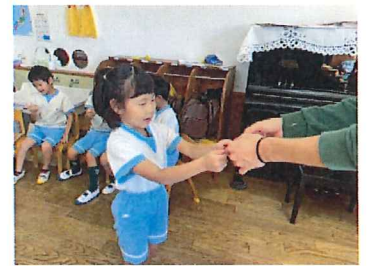
講座を聞き、「にんちしょう キッズサポーターのカード」を頂きました。