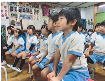
聞いたことのない名前や話しに とても興味を持っていました。