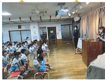
子どもたちにも分かりやすく 説明をして下さいました。