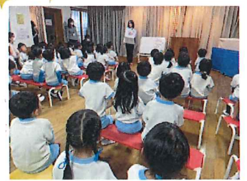
ホワイトボードを使い、とても わかりやすく子どもたちも頷いていました。