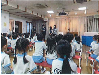
キャラバン・メイトの方々が認知症 ポーターキッズの講座に来て下さいました。